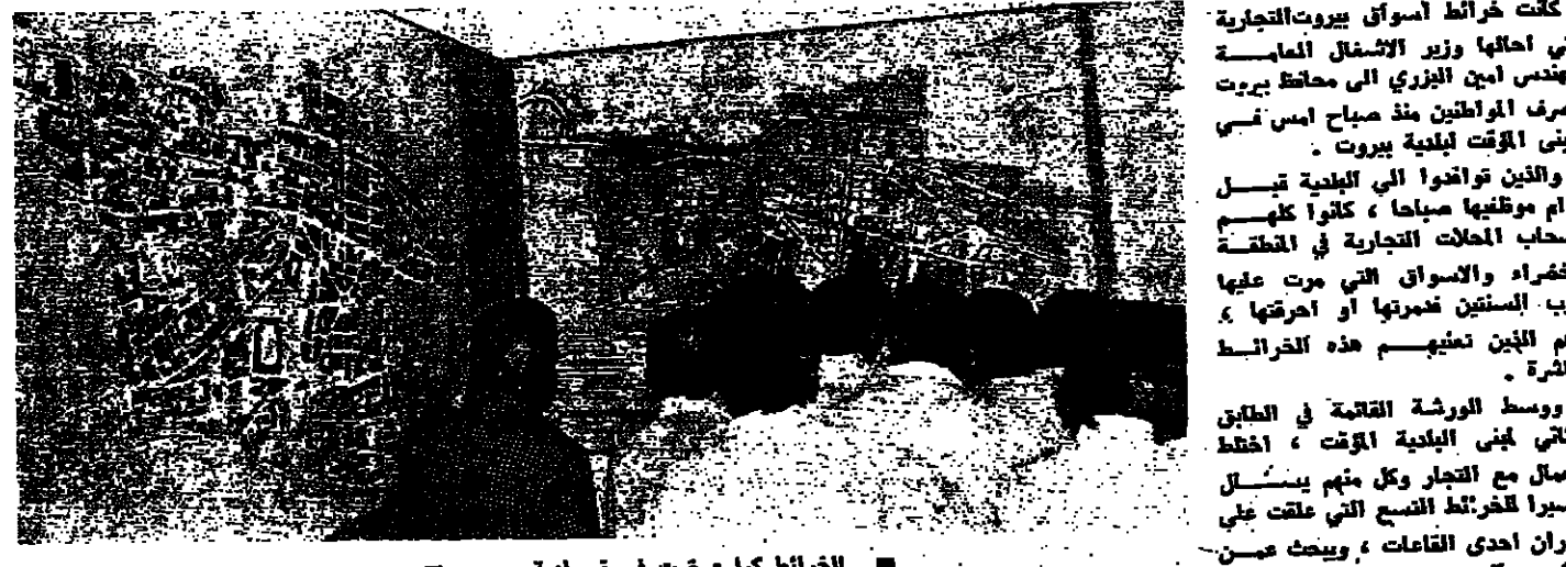
الخرائط كما عرضت في مقر بلدية بيروت

كثفت خرائط اسواق بيروت التجارية التي اطلقها وزير الاشغال العمالية المهندس امين الزبيدي الى محافظ بيروت بصرف المواطنين منذ صباح امس في مبنى الوقت بلدية بيروت .